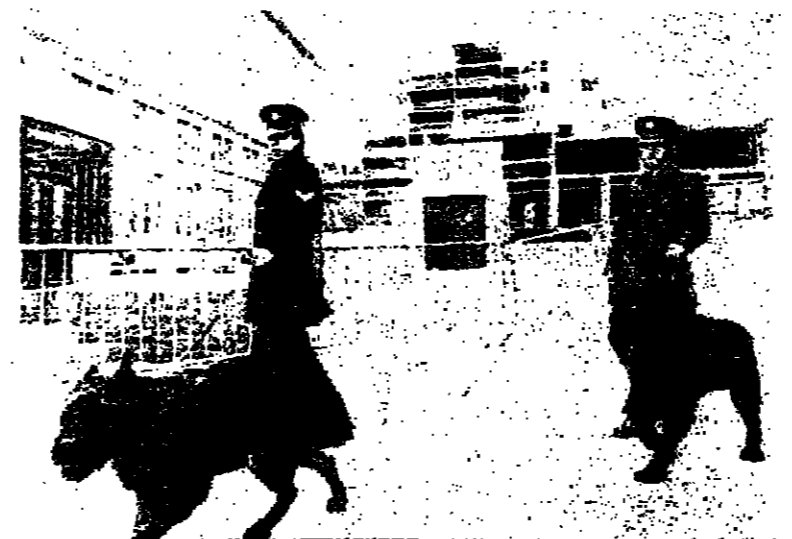
رجال الامن الهولنديون يحيطون بفندق كورهاوس في لاهاي حيث تدور مفاوضات الحكم الذاتي .

وصرح مصدر اميركي بلسان بعوث الرئيس كارتر في هذه المحادثات السيد سول لينوفيتس وحمل مقترحات جديدة لعرضها في هذه الجولة للتغلب موقفي مصر واسرائيل المتباينين كما تجلى في نموذجي المجلس الاداري اللذين تم عرضهما خلال جولة المفاوضات الاخيرة . وصرح مصدر مقرب الى الوفد الاسرائيلي انه لا يعلق املا كبيرة على محادثات لاهاي وانه لن يتخذ اية قرارات جديرة حسم مفاوضات المجلس الاداري ، واصاف المصدر